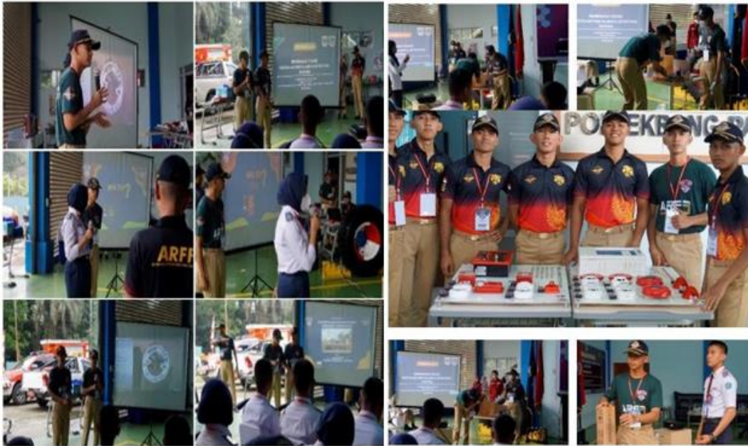
Gambar 2. Dokumentasi Pelaksanaan PkM

Kemudian taruna dengan bimbingan dan pengamatan yang ketat dari dosen melanjutkan praktik instalasi Fire Alarm & Detection System . Dari pengamatan dan pendampingan dosen semua peserta dapat mengikuti penjelasan dari taruna diperkuat dengan penjelasan dosen. Seluruh peserta dapat mempraktekkan sesuai dengan prosedur. Harapannya adalah seluruh peserta dapat langsung mengimplementasikan di kehidupan sehari-hari dalam menginstalasi Fire Alarm & Detection System dan dapat meningkatkan kewirausahaan peserta dalam jasa instalasi Fire Alarm & Detection System . Setidaknya harapannya adalah pernah melakukan ( learning by doing ).