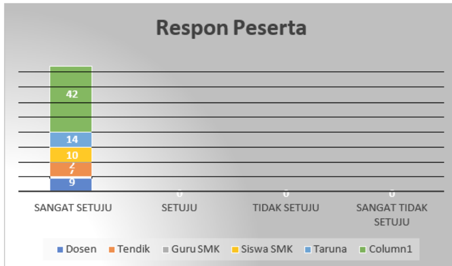
Gambar 4. Respons Peserta 15

Dari grafik yang ditunjukkan gambar 3, jumlah total responder adalah 42 orang, terdiri dari: 1) 9 DTSP PPKP; 2) 7 Tendik PSDT PPK; 3) 2 Guru pendamping SMK Penerbangan Sriwijaya; 4) 10 Siswa-siswi SMK Penerbangan Sriwijaya; 5) 14 Taruna PSDT PPKP. Hasil evaluasi terkait penilaian kepuasan penyelenggaraan PkM ditunjukkan pada gambar 4. Dari total 42 responden peserta yang mengisi evaluasi, 100% menyatakan Sangat Setuju bahwa penyelenggaraan PkM telah dilaksanakan secara positif, dan tidak terdapat pernyataan Setuju, Tidak Setuju, dan Sangat Tidak Setuju (0%). Walaupun 100% besar peserta telah memberikan respons yang positif, masih terdapat respons negatif terhadap pelayanan akan alokasi waktu penyelenggaraan PkM yang diberikan. Komentar dari peserta khususnya Siswa-siswi SMK Penerbangan Sriwijaya menyarankan agar alokasi pelaksanaan dapat ditambah, dan frekuensi penyelenggaraan PkM agar diperbanyak dengan kompetensi lainnya terkait keahlian yang dimiliki PSDT PPKP. Hal ini dapat menjadi fokus PSDT PPKP Politeknik Penerbangan Palembang untuk menambah penyelenggaraan PkM. Sehingga akan semakin banyak/luas lagi masyarakat sebagai penerima manfaat dari PkM. Tidak hanya sekedar sharing pengetahuan, akan tetapi kegiatan PkM hendaknya menjadi media belajar dari dosen dan taruna PSDT PPKP Poltekbang Palembang. Dampak kegiatan pengabdian terhadap pengetahuan sasaran ditentukan dari strategi pengabdian dalam melaksanakan program sesuai kebutuhan (Dyah, N., et al 2022).