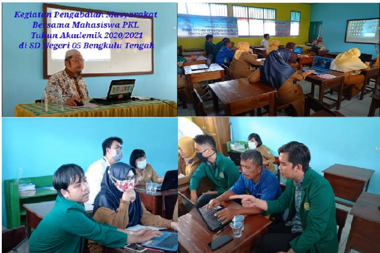
Gambar 1. Kegiatan Pelatihan Aplikasi Microsoft Word dan Excel bagi Kegiatan Administrasi Guru.

Hasil pelaksanaan kegiatan pertama dan kedua dan keempat terrekam dalam foto-foto kegiatan seperti tampak pada Gambar 1, Gambar 2, dan Gambar 3. Beberapa video dokumentasi dapat dilihat pada alamat https://youtu.be/b6IZySLtUmo .