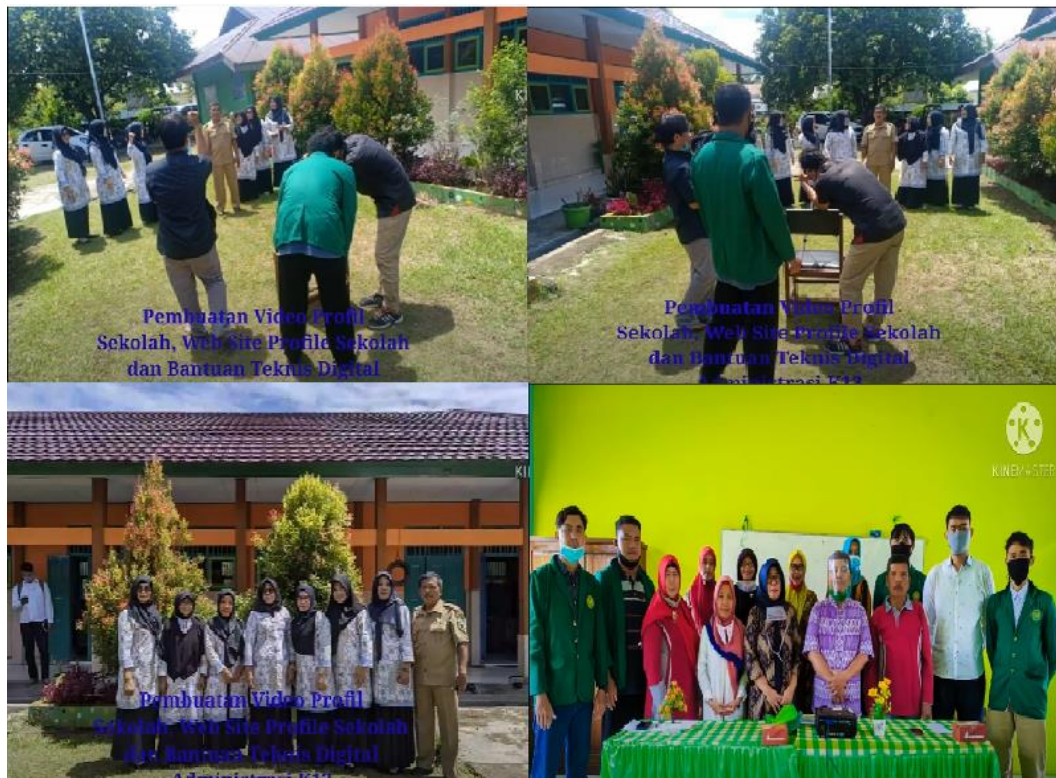
Gambar 3. Kegiatan Pengambilan Frame Video Profil Sekolah dan Closing Frame Video Profil.

Untuk kegiatan pembuatan website sekolah, kami memutuskan untuk memanfaatkan hosting, domain dan template yang hasilnya dapat diakses daring pada alamat URL http://sdn05bengkulutengah.mysch.id . Gambar tampilan muka website tersebut adalah seperti Gambar 4.