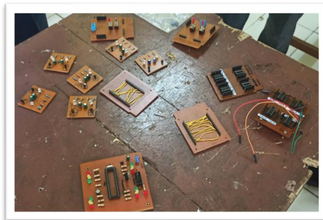
Gambar 1. Trainer Kit Pelajaran Rangkaian Digital

Penjajakan awal telah dilakukan oleh Tim PKM Politeknik Penerbangan Indonesia Curug dengan mengirim beberapa perwakilan dosen ke lokasi calon mitra. Dalam survei lapangan, ditemukan bahwa beberapa alat peraga praktek membutuhkan pengembangan lebih lanjut. Sebagai contoh untuk peraga praktek mata pelajaran Rangkaian Digital saat ini dirancang menggunakan PCB ( Printed Circuit Board ) protoboard dan beberapa menggunakan PCB dengan jalur yang dirancang secara manual menggunakan spidol permanen. Jenis praktek yang dapat dilakukan dengan alat-alat masih terbatas. Gambaran lengkap Trainer Kit yang tersedia saat ini dapat dilihat pada Gambar 1.