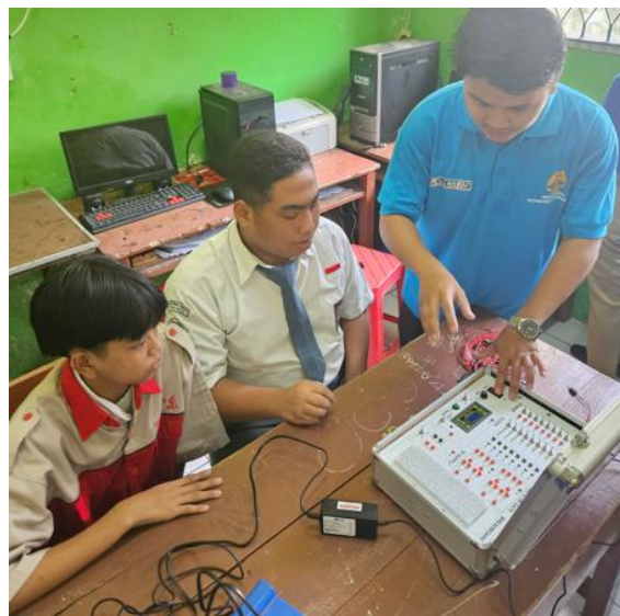
Gambar 10. Uji coba oleh siswa SMK Prima Bakti

Evaluasi kegiatan PKM dilakukan dengan menyebarkan kuesioner kepada peserta uji coba dengan hasil disajikan pada Tabel 2. Sebagian besar responden menyatakan merasa nyaman dan puas dengan adanya Trainer Kit Rangkaian Digital. Hal serupa juga berlaku untuk Modul Praktek Rangkaian Digital yang telah disusun bersama pihak SMKS Prima Bakti. Mayoritas responden menilai modul tersebut mudah dipahami berkat instruksi yang jelas dan terstruktur. Meskipun demikian, beberapa responden mengaku sesekali mengalami kesulitan saat menggunakan Trainer Kit yang disebabkan oleh fakta bahwa responden, yang mayoritas merupakan siswa kelas X, masih berada dalam tahap pengenalan materi terkait Rangkaian Digital.