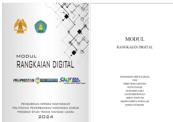
Gambar 9. Halaman sampul modul praktikum Rangkaian Digital