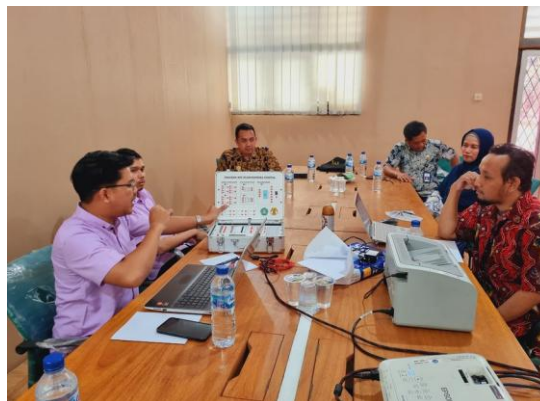
Gambar 8. Pembahasan modul praktek

Modul praktek PKM merupakan pelengkap dari Trainer Kit . Modul praktek ini berisi panduan berupa “ job sheet ” yang akan digunakan oleh siswa saat menggunakan Trainer Kit . Kegiatan ini berlangsung pada tanggal 30 Juli 2024 yang bertempat di SMKS Prima Bakti. Pembuatan modul ini dilakukan bersama dengan Pihak Mitra yang bertujuan agar isi dari modul tersebut tepat sasaran sesuai dengan kebutuhan mitra. Halaman sampul hasil pembahasan Modul Praktikum Rangkaian Digital dapat dilihat pada Gambar 9.