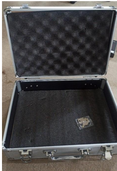
Gambar 4. Kotak aluminium Trainer Kit