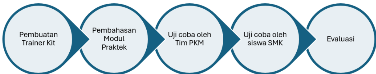
Gambar 3. Alur kegiatan pengerjaan dan pengujian

Kegiatan yang dilakukan bersama antara Tim PKM dan guru produktif SMKS Prima Bakti yaitu dimulai dengan pembuatan Trainer Kit , pembahasan modul praktek, uji coba oleh tim PKM, uji coba oleh siswa SMK hingga evaluasi sebagaimana yang dijelaskan pada gambar 3. Uji coba sendiri merupakan rangkaian yang harus ada dalam sebuah perancangan (Waruwu, 2024). Sedangkan evaluasi diperlukan untuk menilai dan mengukur produk yang dihasilkan (Asrul et al., 2014).