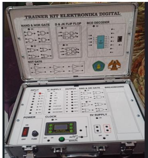
Gambar 7. Trainer Kit yang telah selesai dirakit

Modul praktek PKM merupakan pelengkap dari Trainer Kit . Modul praktek ini berisi panduan berupa “ job sheet ” yang akan digunakan oleh siswa saat menggunakan Trainer Kit . Kegiatan ini berlangsung pada tanggal 30 Juli 2024 yang bertempat di SMKS Prima Bakti. Pembuatan modul ini dilakukan bersama dengan Pihak Mitra yang bertujuan agar isi dari modul tersebut tepat sasaran sesuai dengan kebutuhan mitra. Halaman sampul hasil pembahasan Modul Praktikum Rangkaian Digital dapat dilihat pada Gambar 9.