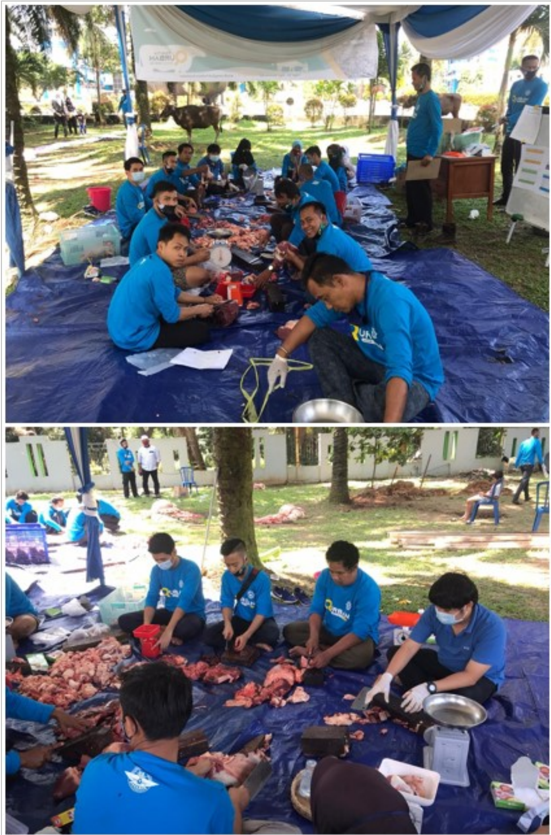
Gambar 2. Dokumentasi Pelaksanaan Kegiatan