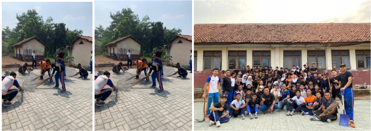
Gambar 3. Kegiatan Pemasangan Paving block dan Penghamparan Abu Batu