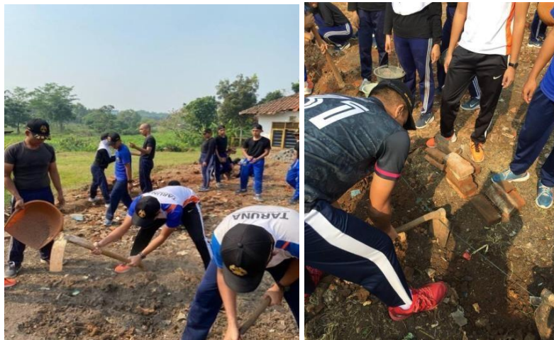
Gambar 2. Pembersihan Lokasi Pemasangan Paving block

Pada hari pertama Sabtu 22 Juli 2023, acara diawali dengan pembukaan pelaksanaan pengabdian kepada masyarakat. Acara dilanjutkan dengan melakukan pembersihan lokasi yang akan dipasang paving block dengan dibantu oleh taruna dan taruni Program Studi Teknik Bangunan dan Landasan seperti gambar 2. Kemudian kegiatan dilanjut dengan pemasangan batu bata sebagai pengganti kansteen di sekeliling lokasi yang akan dipasang paving block . Batu bata ini berfungsi sebagai penahan agar paving block nantinya tidak mudah bergeser.